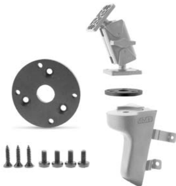
Art.-Nr. / Item No.: BIGDH