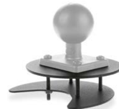
Art.-Nr. / Item No.: BIGMP

for direct screwing on flat surfaces, for heavy equipment