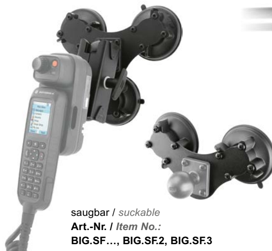
saugbar / suckable Art.-Nr. / Item No.: BIG.SF..., BIG.SF.2, BIG.SF.3