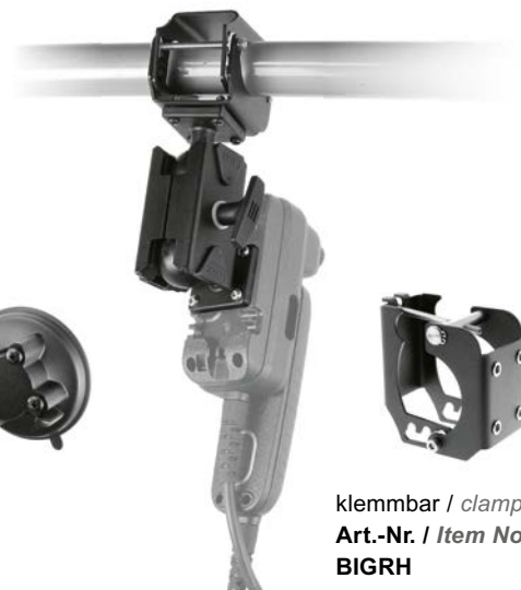
klemmbar / clampable Art.-Nr. / Item No.: BIGRH