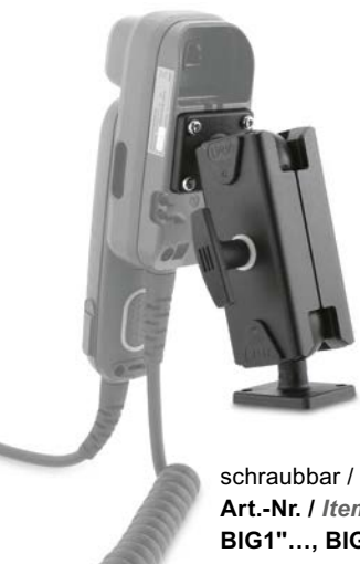
schraubbar / screwable Art.-Nr. / Item No.: BIG1"..., BIG1.5"...